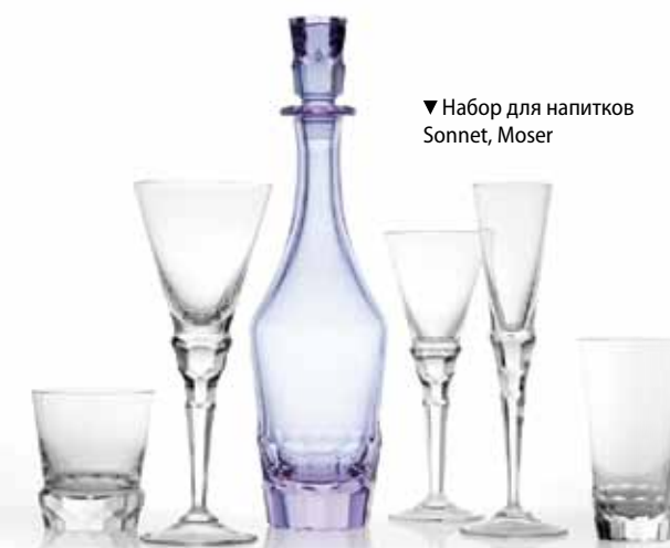
▼ Набор для напитков Sonnet, Moser