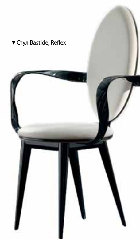
▼ Стул Bastide, Reflex