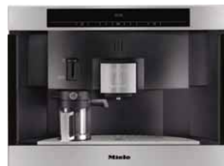
◀ Кофемашина, Miele

Ежевичный, малиновый, сливовый, цвет смородины, черники и вишни... При всем своем «вкусном» звучании они так редко занимают место в зоне кухни или столовой. И совершенно не заслуженно! Кроме необыкновенной яркости они поднимают настроение, заряжают энергией и даже улучшают аппетит! Для данной кухни был выбран ягодный черничный. Сочетание этого цвета с белым и серебристым сделало интерьер торжественным, а антрацитовые детали придали графичности. Несмотря на холодный фиолетовый подтон, кухня выглядит достаточно теплой и уютной. Все это благодаря одной небольшой детали – витражу в оттенках физалиса.