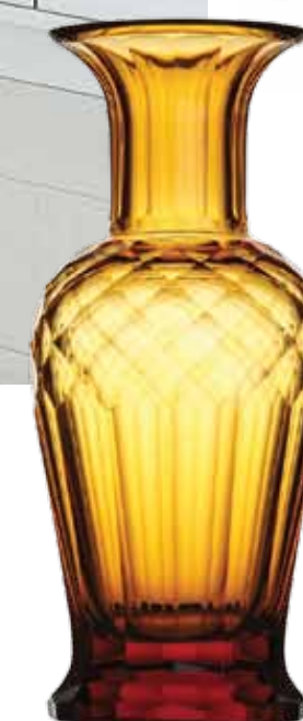
▲ Ваза Verona, Moser