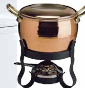
▲ Набор для фондю La Cremeria, Ruffoni