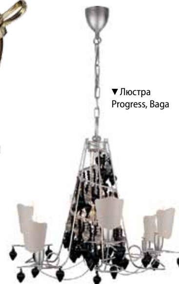
▼ Люстра Progress, Baga