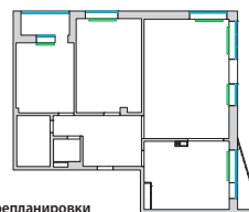
План до перепланировки

Когда я узнал об акции «Собираем интерьеры», решил, что это как раз то, что мне нужно. И не ошибся. Отобрав из множества вариантов понравившиеся интерьерные решения, я увидел, как они могут быть «переложены» на мою жилплощадь. Интерьер получился цельным, логичным. Я сам по профессии строитель, поэтому мне особенно понравилось, что дизайн-студия предложила наряду с визуализацией конкретные строительные планы, чертежи. Подробная документация, по которой легко осуществить задуманное – пожалуй, самое ценное в проекте лично для меня. Сочетание цены и качества – вне конкуренции, за разумные деньги я получил именно то, что хотел.