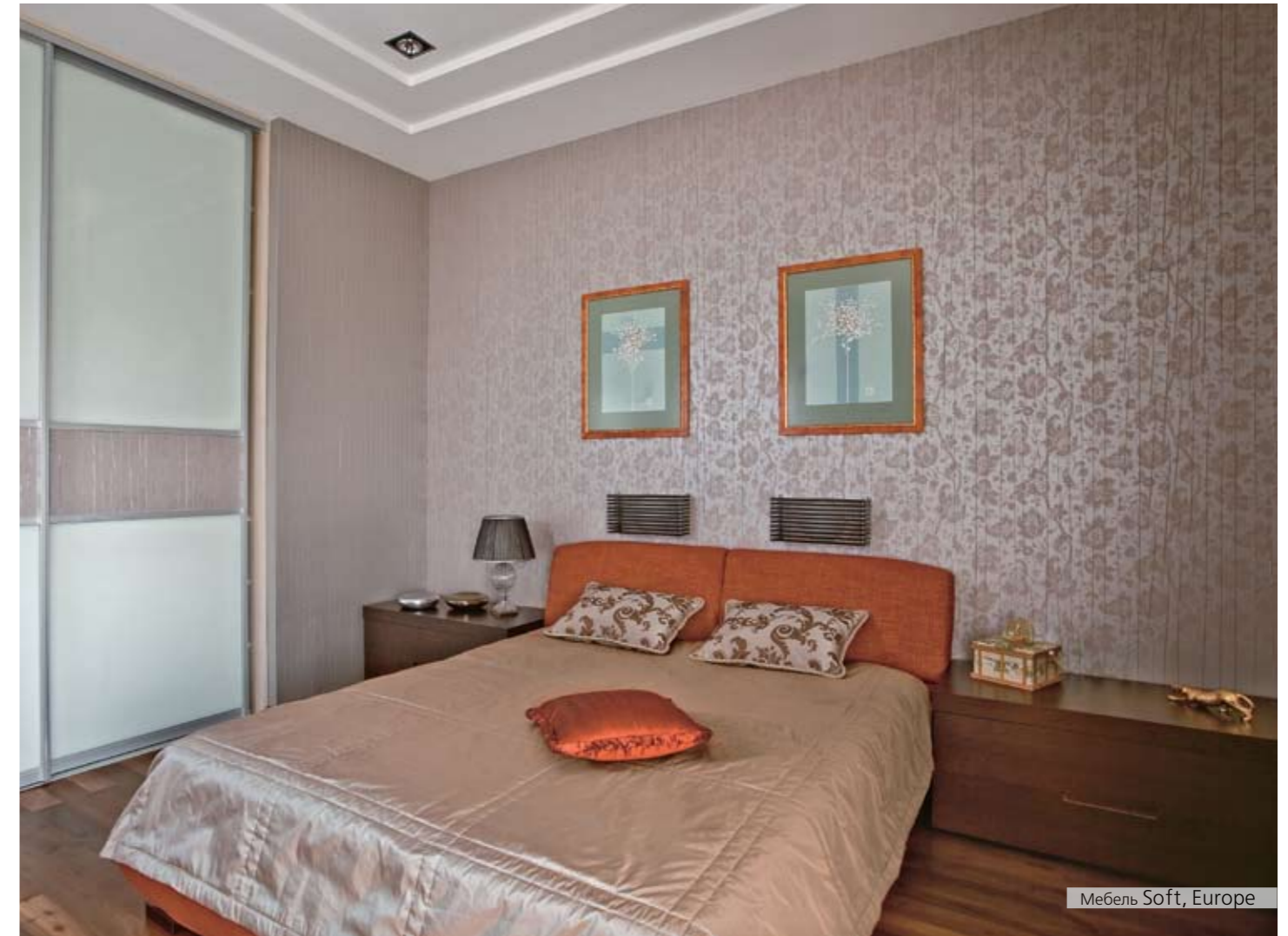
Мебель Soft, Europe