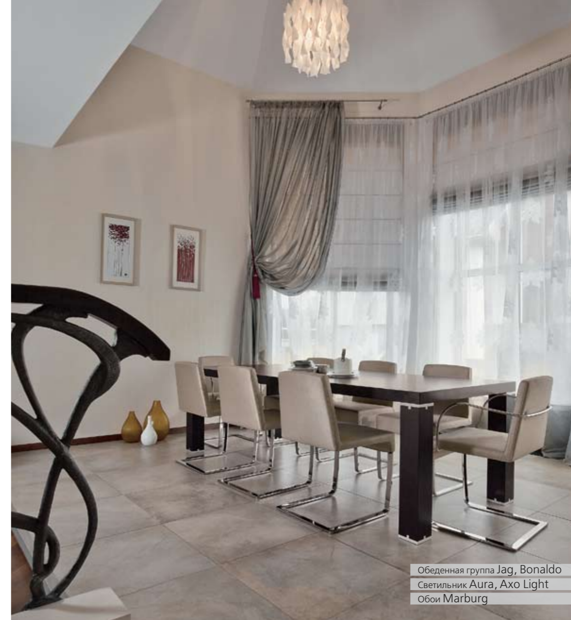
Обеденная группа Jag, Bonaldo Светильник Aura, Axo Light Обои Marburg