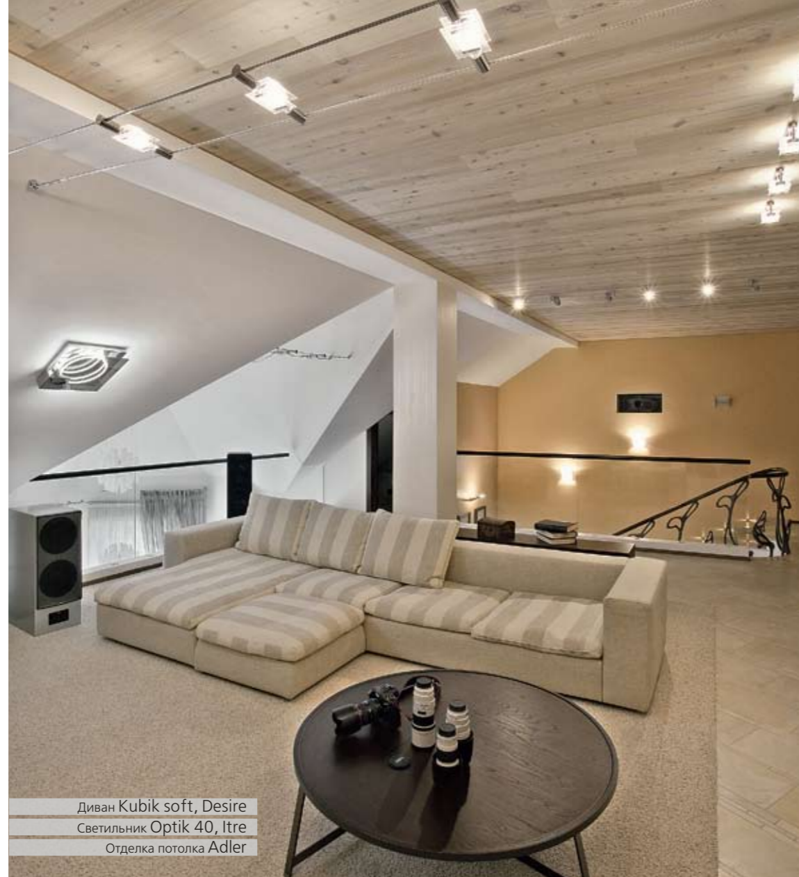
Диван Kubik soft, Desire Светильник Optik 40, ltre Отделка потолка Adler

Сложная архитектура мансардного этажа подчеркнута удачным выбором фактур: тонированного дерева потолка и декоративной штукатурки стен